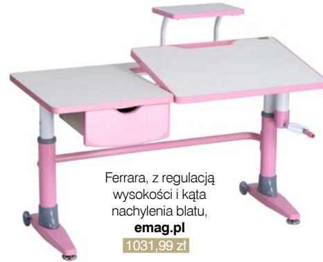
Ferrara, z regulacją wysokości i kąta nachylenia blatu, emag.pl 1031,99 zł