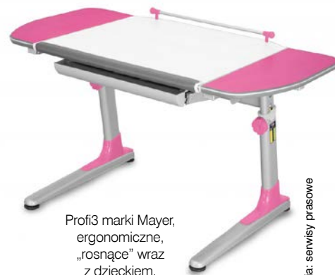
Profi3 marki Mayer, ergonomiczne, „rosnące” wraz z dzieckiem, 4kidspoint.pl 1499 zł