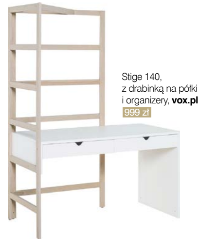
Stige 140, z drabinką na półki i organizery, vox.pl 999 zł